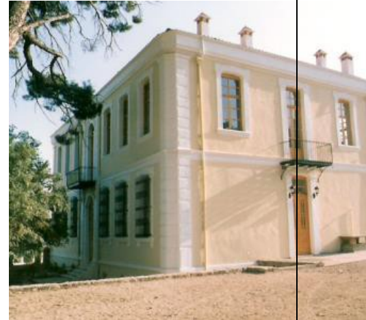
1 ο Δημοτικό Σχολείο