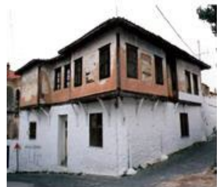
Πρώην οικία Μητροπολίτη