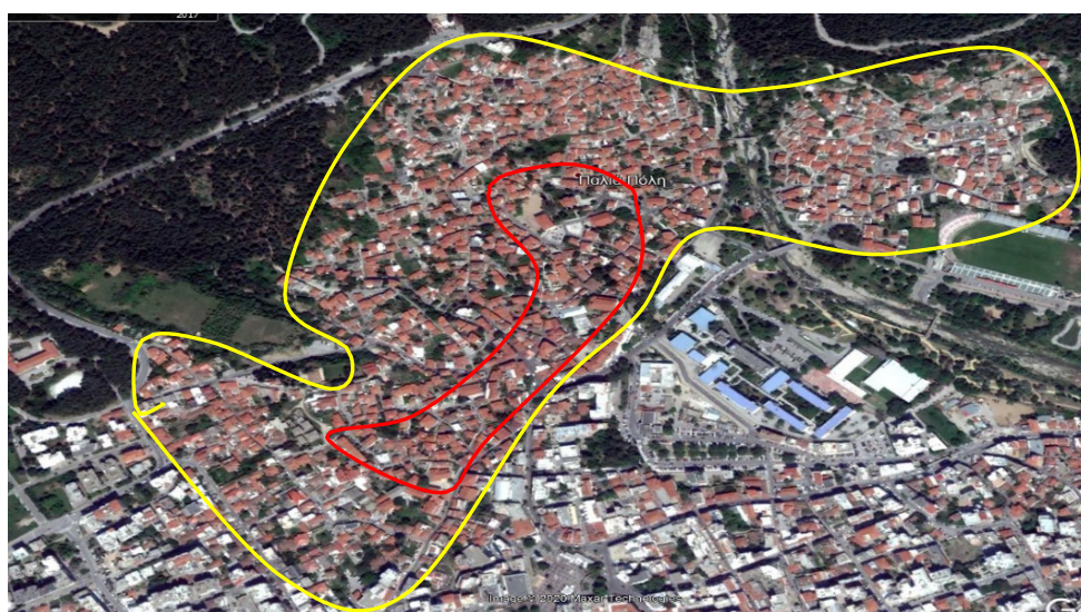
Εικόνα 1. Το Παλαιό τμήμα της Ξάνθης που χαρακτηρίστηκε το 1976 ως «τόπος χρήζων ειδικής Κρατικής Προστασίας» περιβάλλεται με κίτρινη γραμμή. Με κόκκινη γραμμή σημειώνεται το ιστορικό κέντρο της παλιάς πόλης

Το 1976 με αποφάσεις του Υπουργού Πολιτισμού (ΦΕΚ 612B/30-4-1976 και ΦΕΚ 661/B/17-5-1976) χαρακτηρίστηκε το Παλαιό τμήμα της Ξάνθης ως «τόπος χρήζων ειδικής Κρατικής Προστασίας» (βλ. Εικόνα 1)