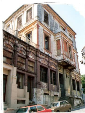
Οικία Ισάκ Δανιέλ