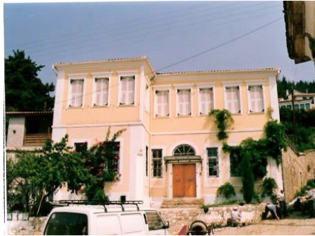
Οικία Δημάρχου Χασιρτζόγλου