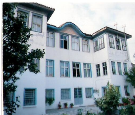
Οικία Μουζαφέρ Μπέη