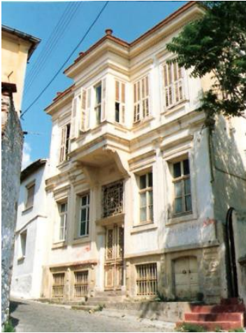
Οικία Καπνεμπόρου Στάλιου